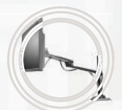
Suporte Lenovo™ com Ajuste de Altura