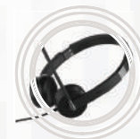
Headset Estéreo Lenovo™