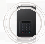
HD Protegido para Desktop Lenovo™